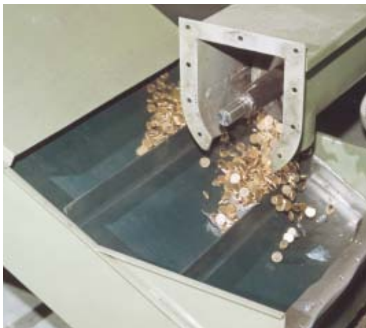
Monedas, junto con restos de bolsas y embalajes, antes de ser destruidas.

Ha estado centralizada en la planta de «Botrade» en Zaragoza. Previa notificación de su envío, allí llegaban las monedas procedentes de los once almacenes regionales. Antes de proceder a su descarga se consultaba en el sistema informático si dicho envío había sido convenientemente notificado; si era así, se grababa la relación de carga.