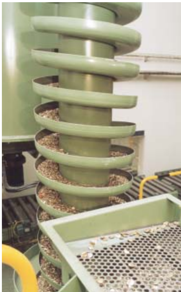
Al final de la criba los fragmentos demasiado grandes eran enviados de nuevo al proceso de corte.

El sistema tenía predeterminado un tamaño de troceado; si por algún motivo aparecía algún fragmento mayor de lo previsto, era devuelto a la máquina de troceado. La chatarra finalmente obtenida caía en una tolva donde se iban llenando los recipientes de salida, diferentes a los que trajeron las monedas. Una báscula programada controlaba el peso y desplazaba el recipiente al alcanzar el peso especificado. El sistema informático, tras conocer el peso de cada contenedor, generaba un registro e imprimía una etiqueta con el número de embalaje. Finalmente, las cajas, convenientemente etiquetadas y precintadas, eran enviadas al almacén.