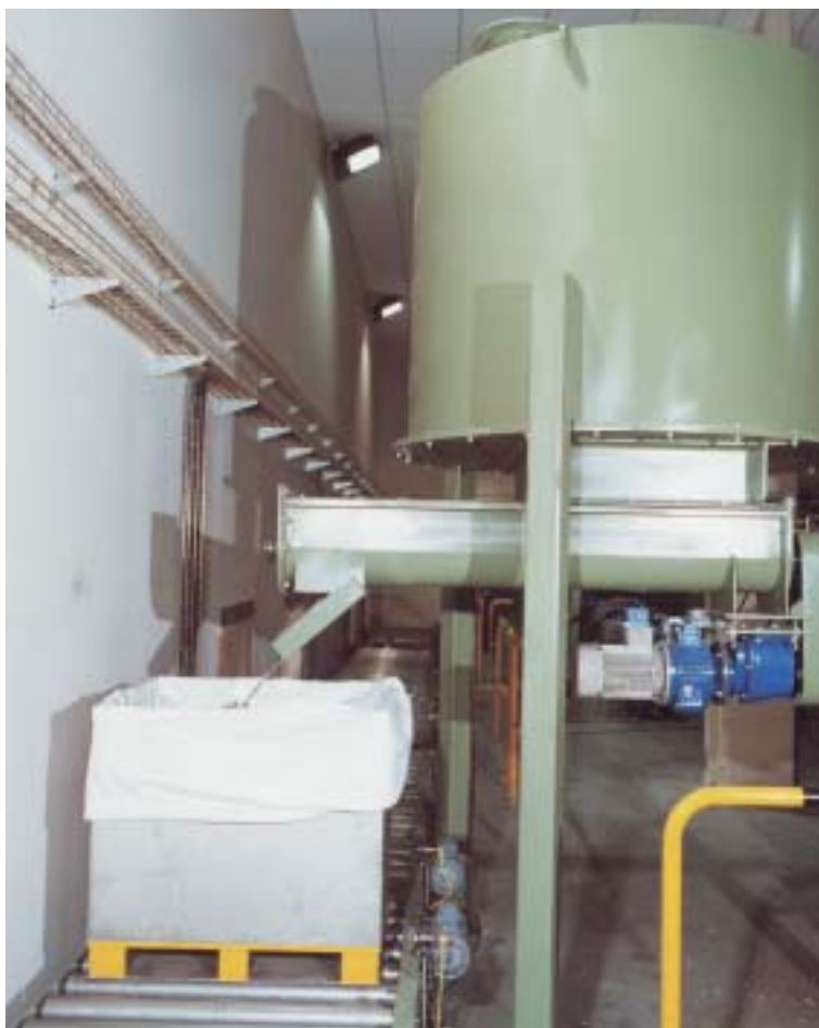
La chatarra finalmente obtenida se introducía en contenedores convenientemente pesados y clasificados para su posterior comercialización.