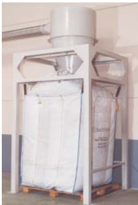
Los restos de bolsas y embalajes eran retirados del proceso por aspiración y finalmente pesados y compactados para su posterior comercialización y reciclado.