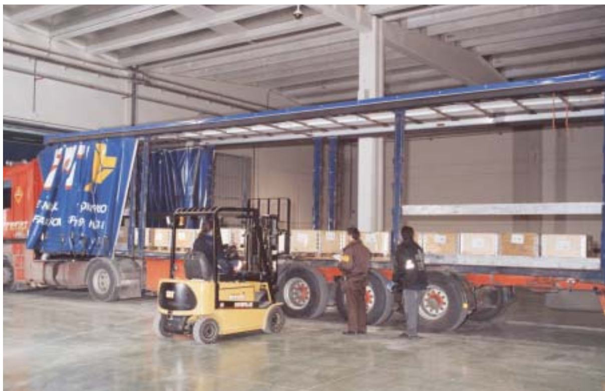
Para trasladar todas las monedas se han necesitado 3.960 transportes.

El Banco de España y los diferentes bancos comerciales han sido los encargados de retirar las monedas de circulación. Una vez cambiadas por los ciudadanos, las monedas se introducían, separadas por faciales, en bolsas o blíster y éstos a su vez en cajas-palets, que periódicamente eran retirados en todo el territorio nacional por las empresas de seguridad que los almacenaban hasta que los retiraba la FNMT-RCM para enviarlos a los almacenes regionales.