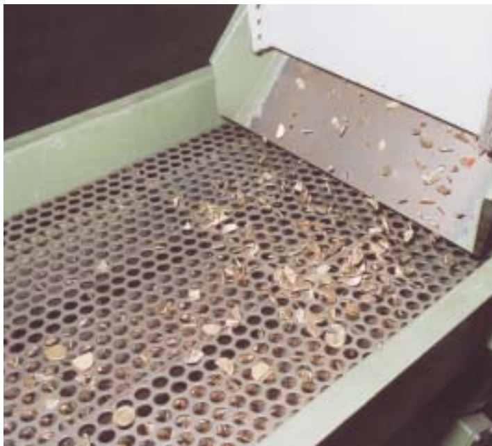
Una criba separaba los fragmentos que tenían el tamaño adecuado de los que eran demasiado grandes.

Una vez en el proceso de inutilización se procedía a la apertura de las cajas y al rasgado de los embalajes por medio de unas cuchillas. Posteriormente, el material de embalaje, que es menos denso, era retirado por aspiración e iba a una salida donde era pesado y compactado. Este material, aunque de poco valor, luego era vendido. Además, por seguridad, había que conocer su peso.