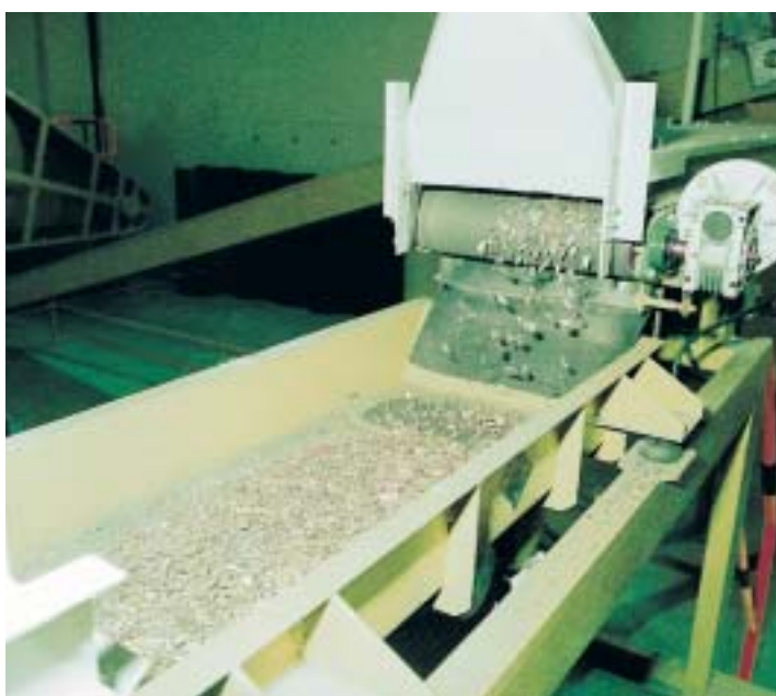
Las monedas después de fragmentadas eran enviadas a una criba.

Las monedas eran destruidas por campañas, es decir, durante un determinado periodo de tiempo sólo se inutilizaba un tipo de moneda. Al entrar una caja en el proceso se anotaba su número, se pesaba y automáticamente se hacía un control entre el peso de báscula y el peso teórico, calculado en función del tipo y número de monedas y envases contenidos en la caja (monedas + bolsas + blíster + cajas). Si el peso calculado de la caja difería del peso real en una cantidad dentro de los