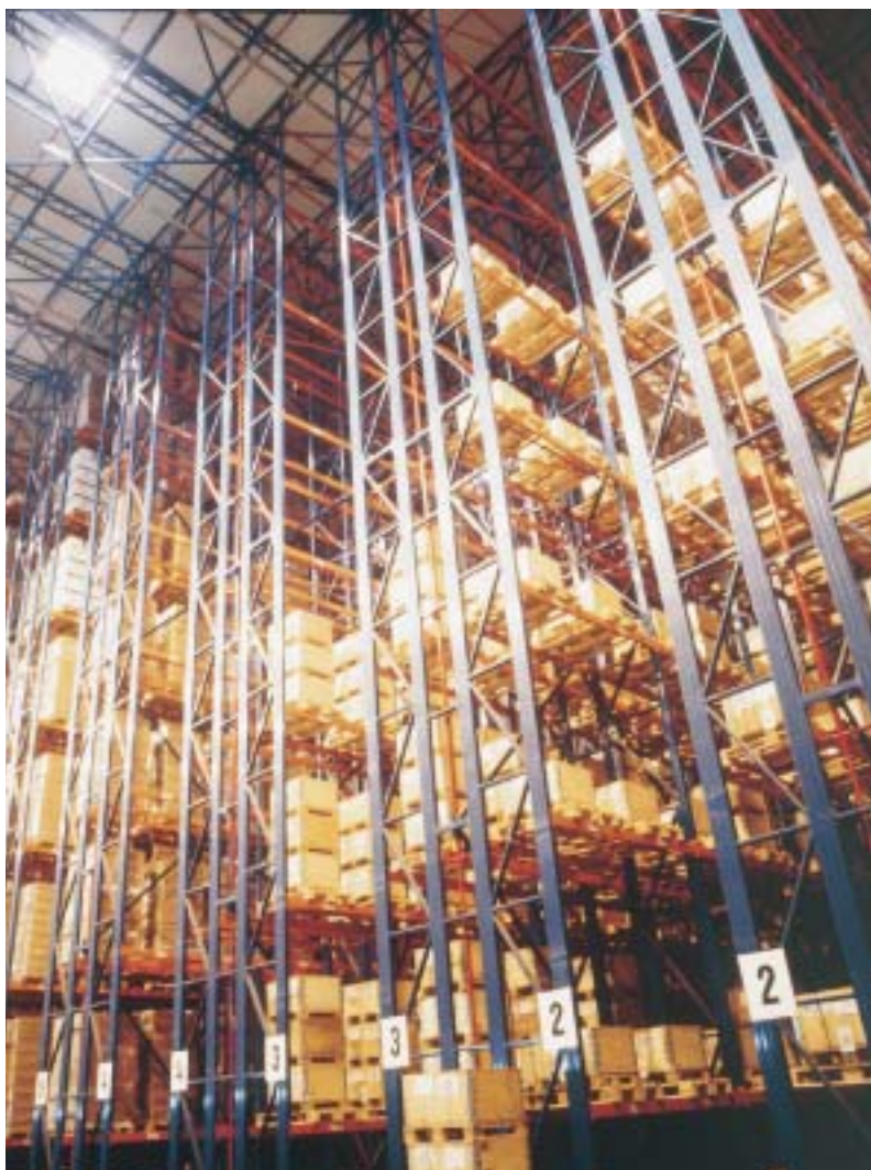
Sistema de almacenaje empleado en los almacenes regionales y central.

Un aspecto importante fue decidir la manera de inutilizar las monedas. Había que elegir entre un sistema térmico (fundición directa o fundición indirecta) o un sistema mecánico (deformación o rotura). El inconveniente de los sistemas térmicos es que requieren que las monedas estén libres de envoltorios plásticos, cuya eliminación previa supone una manipulación costosa e insegura. Además, los hornos que podrían ser utilizados para tal efecto no tienen capaci-