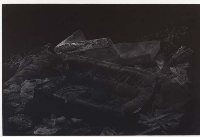
"The remains of the painful things"

(Lampang, 1989), joven artista tailandés licenciado en Bellas Artes por la Universidad RMUTL de Tailandia, y Máster en Artes Gráficas por la Universidad Silpakorn de Nakhon Pathom. Ha participado en diversos certámenes y exposiciones de arte gráfico como la Trienal de Grabado de Cieszyn 2017 (Polonia), la muestra "Just Under 100: New Prints 2017 / Summer" en The International Print Center (Nueva York), el Festival Internacional de Mezzotinta (Rusia), o la Bienal Internacional de Obra Gráfica 2015 de Guanlan (China).