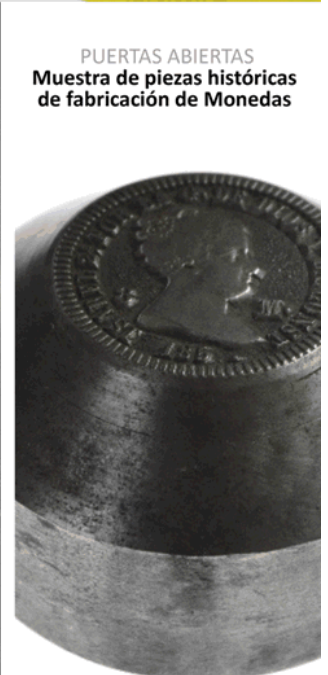
PUERTAS ABIERTAS Muestra de piezas históricas de fabricación de Monedas

Dirección de Relaciones Institucionales, Comunicación y Protocolo Área de Comunicación Fábrica Nacional de Moneda y Timbre-Real Casa de la Moneda Jorge Juan, 106 28071 – Madrid TL: 91 566 65 96/97 E-mail: gprensa@fnmt.es Web: www.fnmt.es