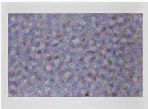
Scenery over there_014_05