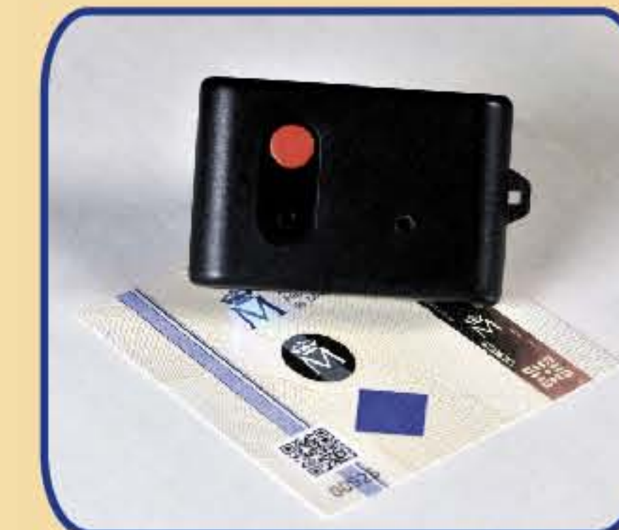
19. Trazadores UV