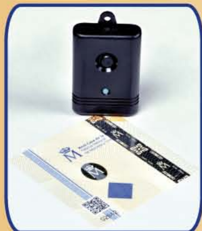
10. Trazadores IR