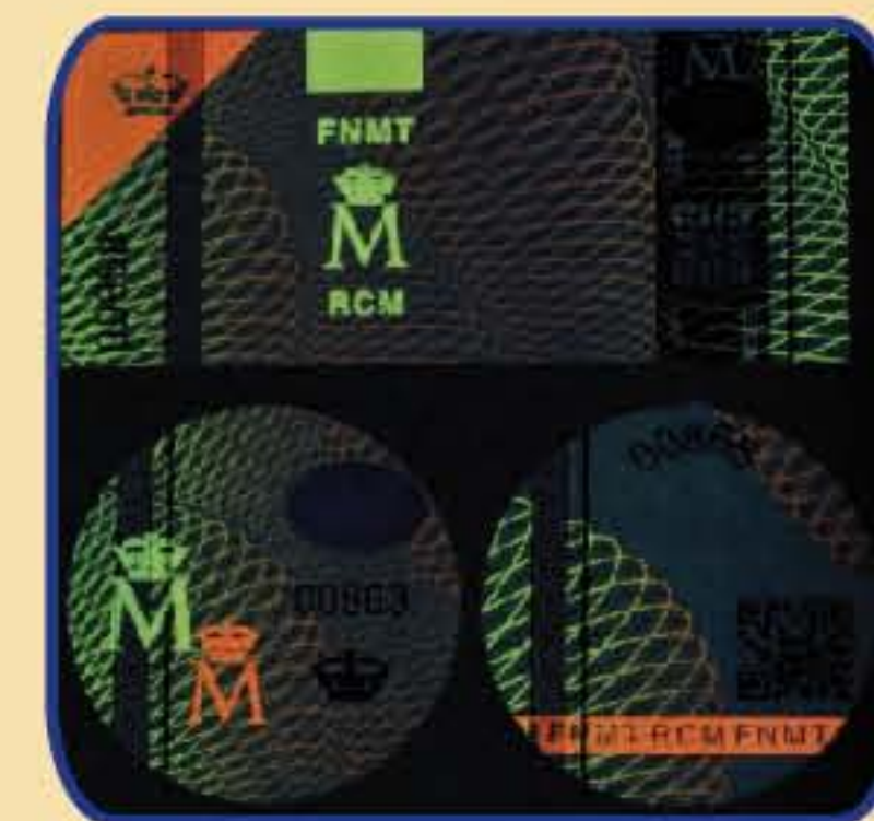
18. Diseños a medida