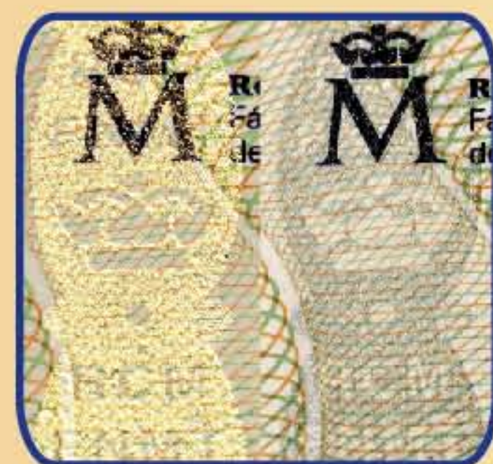
11. Tintas iridiscetes