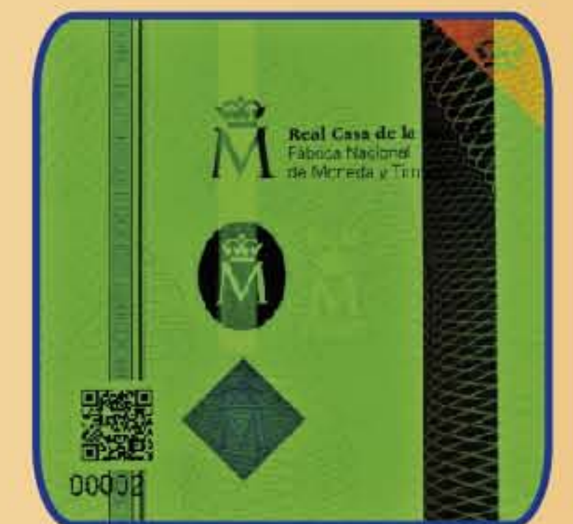
20. Soportes especiales y a medida