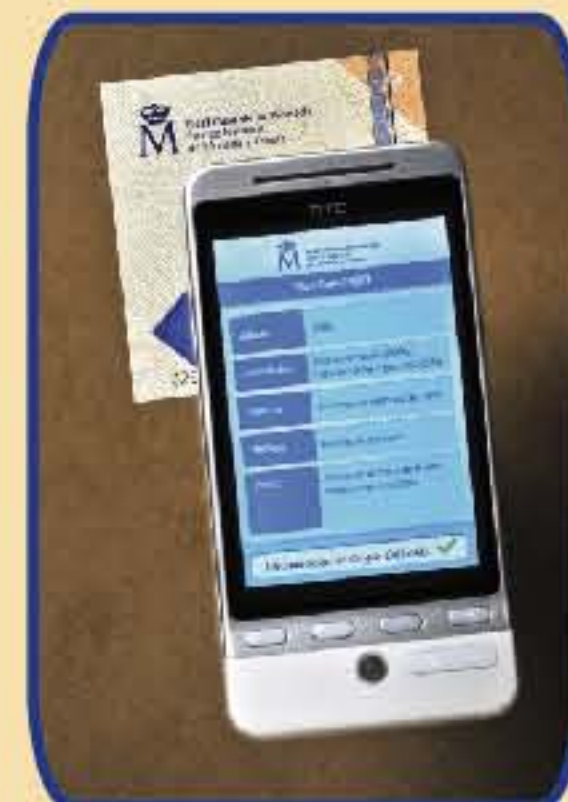
12. Marca de agua digital